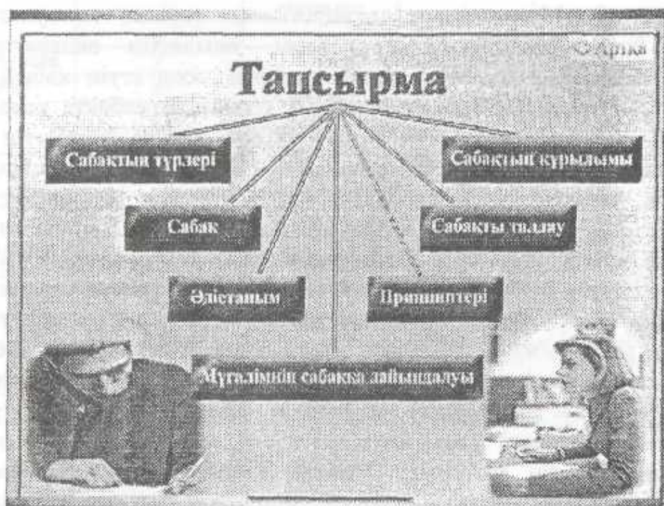
3 сурет-Тапсырма түрлері.

Тапсырмаларды тексеру шағын модульді аяқтағаннан соң, ал тест арқылы бақылау негізгі модульді өткеннен соң жүргізіледі. Студенттердің дидактикалық және әдістемелік даярлықтарына арналған тапсырмалар олардың белсенділігін қалыптастырады.