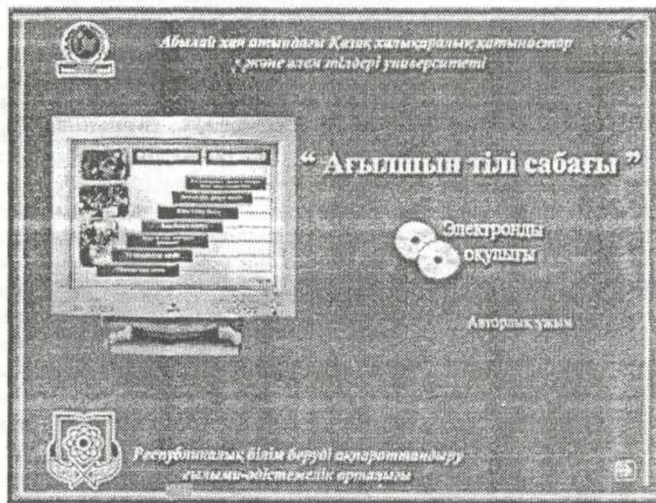
1 сурет- «Ағылшын тілі сабағы» электрондық оқулығы.

«Ағылшын тілі сабағы» электрондық оқулығының бағдарламасы Қазақстан республикасы Білім және ғылым министрлігі бекіткен жоғары оқу орындарына арналған типтік бағдарлама негізінде жасалған. Бұл электрондық оқулық коммуникативтік-практикалық мақсатты көздейді және сауатты болашақ ағылшын тілі мұғалімдерін әдістемелік тұрғыдан даярлау, студенттердің сөйлеу мәдениетін жетілдіру, өзара коммуникативтік қарым-қатынасты жандандыру, интеллектуалдық біліктілікті арттыруды басшылыққа алады.